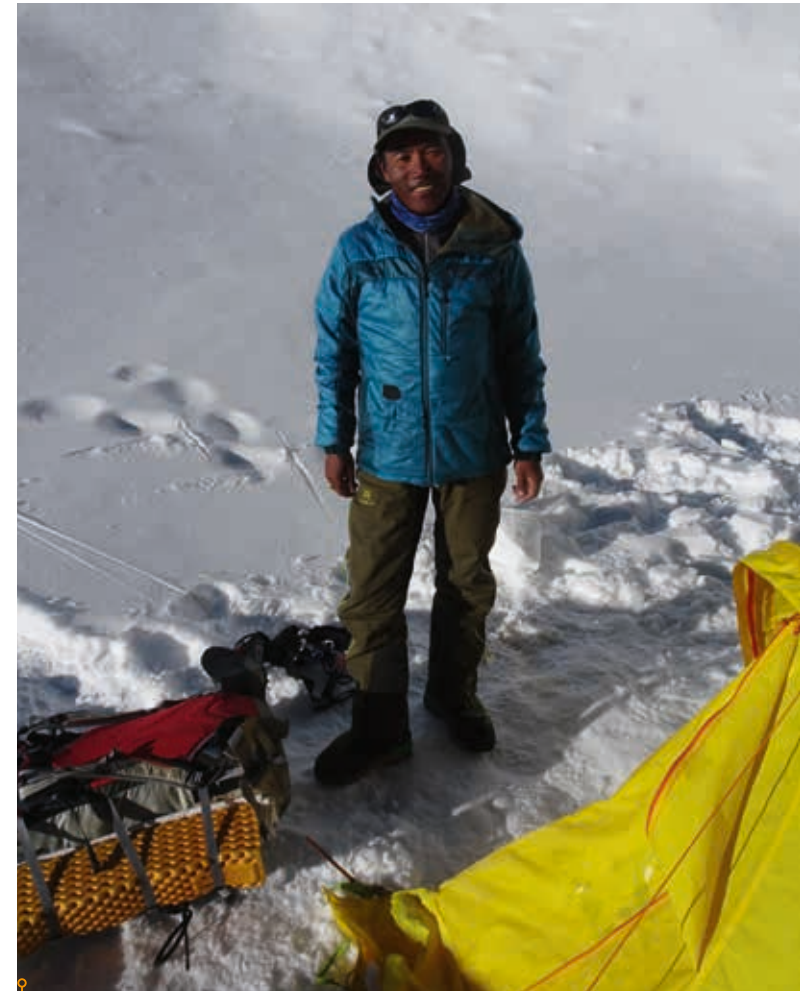
KAMI RITA – SZERPA Z REKORDEM GUINNESSA.

Gdy zadaję mu pytanie o przyszłość zawodu szerpy, Kami zamyśla się. „Młodzi Szerpowie nie chcą się wspinać, bo to trudne i niebezpieczne. Nie są zainteresowani górami. Za kilka lat pracujących na wysokogórskich wyprawach Szerpów nie będzie...” Czy jego pesymistyczny scenariusz się sprawdzi?